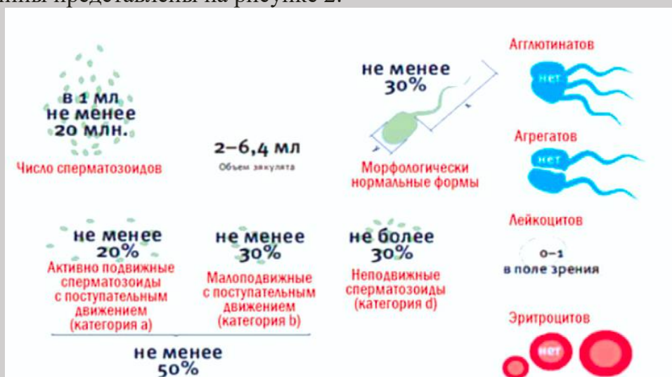
Рисунок 2. Показатели спермограммы здорового мужчины

Согласно исследованиям, у курящих мужчин снижается концентрация сперматозоидов на 23%, ухудшается подвижность на 13%, нарушается их морфология (дефекты головки, шейки или хвоста), часто встречается фрагментация ДНК (она связана с увеличением частоты самопроизвольных аборт). Только у 6% курящих мужчин результаты спермограммы приемлемы для зачатия, в то время как среди некурящих этот показатель составляет 37%. Показатели спермограммы тем хуже, чем больше стаж курения. У курильщика со стажем 15-20 лет подвижность сперматозоидов может снизиться на 80%. Показатели спермограммы здорового мужчины представлены на рисунке 2.