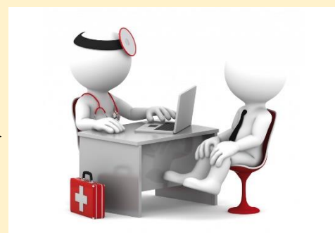
ЭЛЕКТРОКАРДИОГРАФИЯ, ИЗМЕРЕНИЕ ВНУТРИГЛАЗНОГО ДАВЛЕНИЯ (каб. 7)