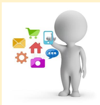
РЕГИСТРАТУРА (1 этаж)