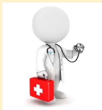
СЕМЕЙНЫЙ ВРАЧ (каб. 1, 2, 4)