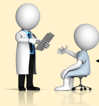
КАБИНЕТ ГИНЕКОЛОГА № 6