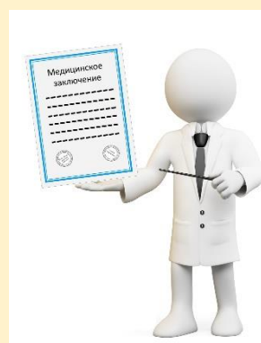
КАБИНЕТ МАММОГРАФИИ (1 этаж)